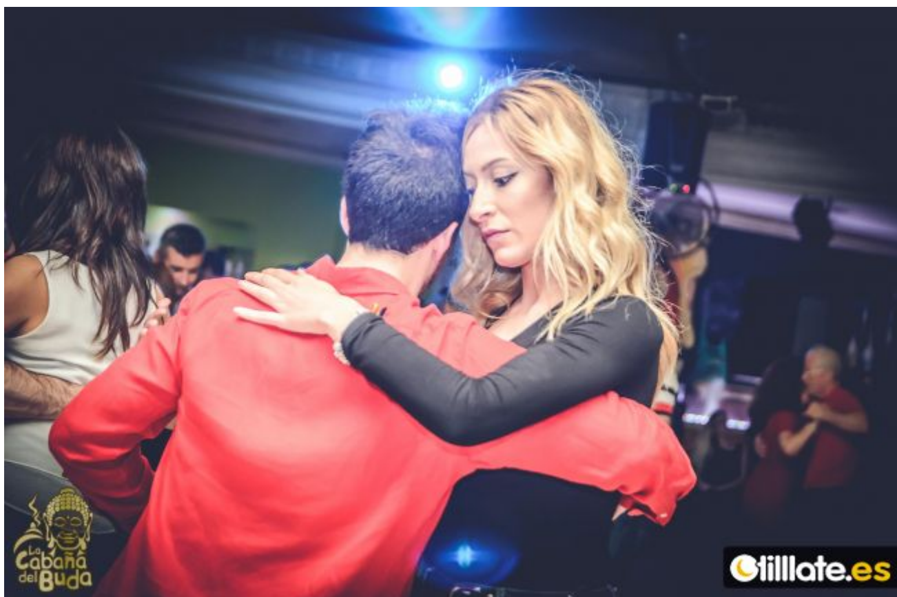
Friday at La Cabaña del Buda , Chiclana