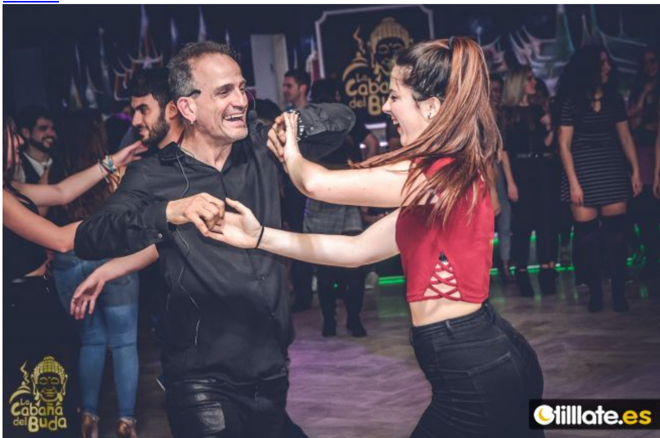
Viernes en La Cabaña del Buda, Chiclana 16.03.18